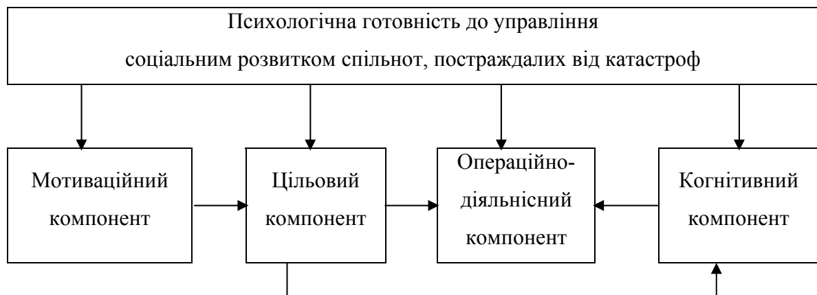
Рис. 2. Модель психологічної готовності до управління соціальним розвитком спільнот, що постраждали від катастроф.

Спираючись на вже розроблені теоретичні моделі готовності фахівців (О.В. Бузова, Л.М. Карамушка та ін.), результати аналізу соціально-психологічних наслідків катастроф, тенденцій сучасної практики управління постраждалими спільнотами, а також структуру діяльності менеджера щодо соціального управління, ми пропонуємо чотирьохкомпонентну модель психологічної готовності муніципальних та регіональних менеджерів до управління соціальним розвитком спільнот, що постраждали від катастроф (рис 2).