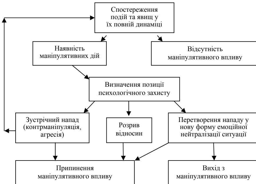
Рис. 1. Стратегія особистісного захисту від маніпуляції у процесі спілкування

Стратегії особистісного захисту від маніпуляції у процесі спілкування описуються як послідовний процес, що починається з виявлення маніпулятивного наміру (рис. 1) і закінчується методами припинення маніпулятивного впливу (рис. 2).